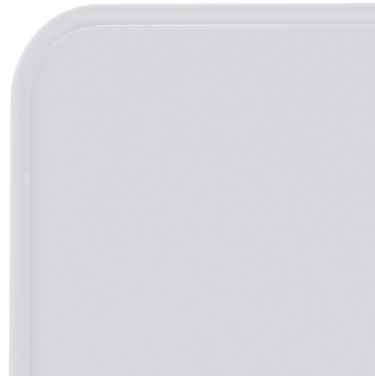
Emaille - Weiß