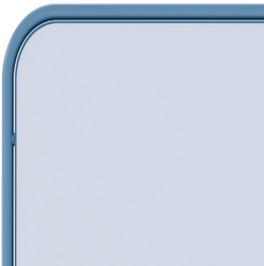
Emaille - Blau