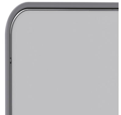
Emaille - Grau