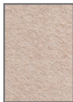
AP/9-22 Dark Camel