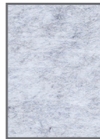
AP/9-12 Silver grey