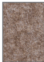
AP/9-39 Light Oak